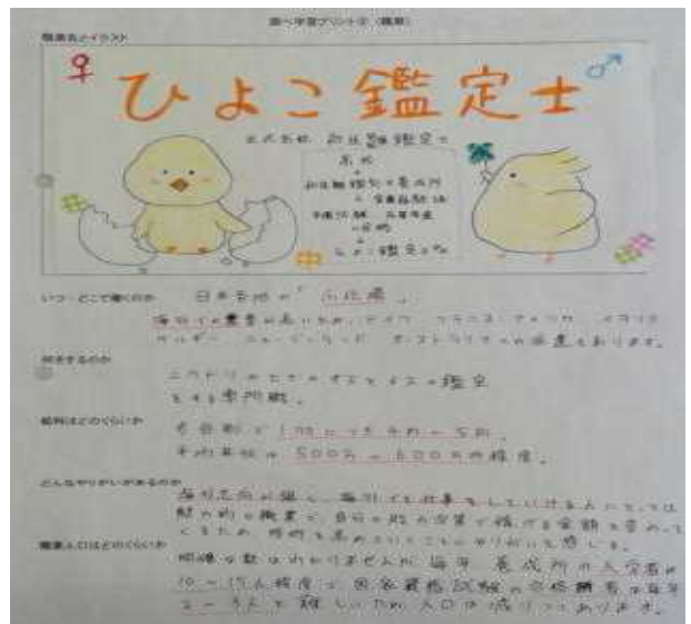
(生徒の反応と課題、改善を要する点)

生徒は興味を持って調べ学習に取り組んだ。自分の調べた職業を英語で伝えようとする姿勢を、電子黒板や一人一台端末の補助を使うことで、効果的に促すことができた。発表者が、ワークシートを写した電子黒板画面を、いかに効果的に扱えるかが今後の課題である。