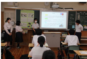
生徒の発表の様子