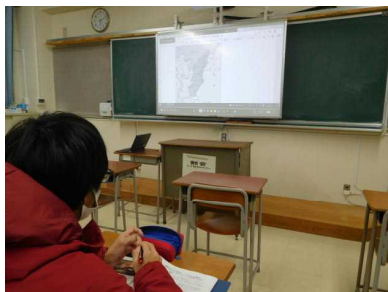
電子黒板への投影