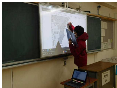
作業結果を電子黒板に書込